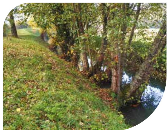
Le ruisseau du Courneau à Montussan.