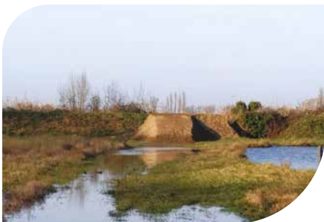
Renforcement des digues à Saint-Loubès.