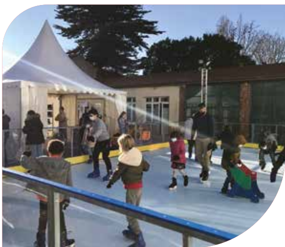
Patinoire éphémère à Saint-Loubès du 18 décembre au 2 janvier. À l'instar du chemin du Trappeur installé à Yvrac début décembre, elle a créé beaucoup d'animation pour les enfants (et les parents !). Les deux équipements ont été financés par la Communauté de communes.