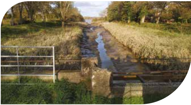
L'embouchure de la Laurence, qui se jette dans la Dordogne (visible au fond) à Saint-Loubès.