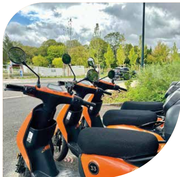
Les scooters e-dog.

Le service est déjà actif à Sainte-Eulalie, Montussan et prochainement à Yvrac. Une extension est envisagée à Saint-Loubès.