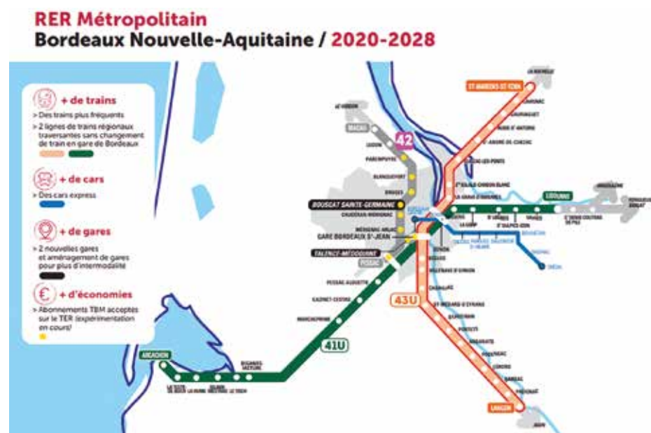
Carte du projet de RER Métropolitain en cours de déploiement. Les gares de Saint-Sulpice/Izon, de Saint-Loubès et de Sainte-Eulalie/Carbon Blanc sont concernées.

Hub* : dans le domaine des transports, un hub est une plateforme / pôle de correspondance entre différents modes de déplacement (avion, voiture, train, vélo, etc.).