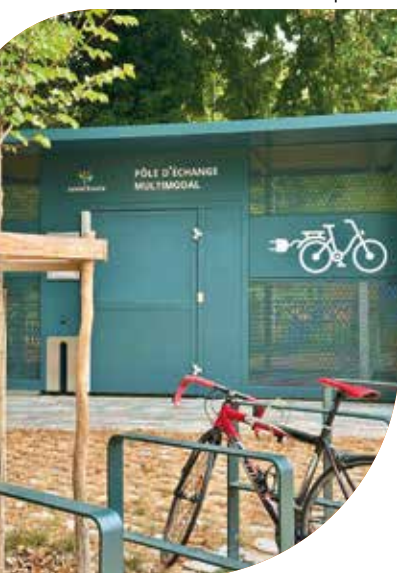
L'abri-vélo sécurisé à Sainte-Eulalie.